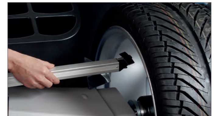
Измерительный рычаг Патентованная технология точного позиционирования клеевых грузов на колесе