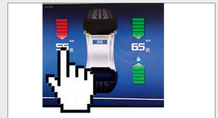
Функция Stop-in-Position Оператору нужно только коснуться указателя массы груза на экране, и колесо автоматически поворачивается в положение уравнивания.