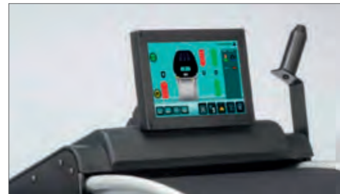
geoTOUCH™: 10"сенсорный дисплей для VAS 741 059, VAS 741 057 и VAS 741 055