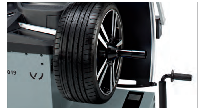
Защитный кожух Патентованный телескопический защитный кожух колеса - дополнительное место сзади стенда не требуется.