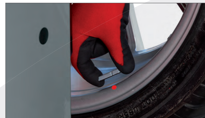
Точечный лазерный указатель Быстрое, точное и простое решение позиционирования клеевых грузов на колесе.