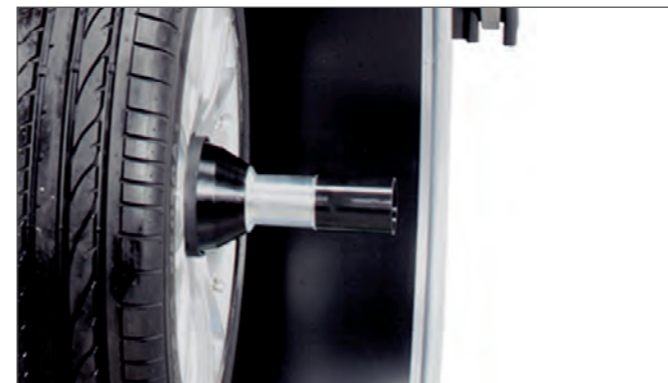
Power Clamp™ Зажимное устройство Power Clamp™: надёжное, быстрое и точное крепление колеса без усилий оператора