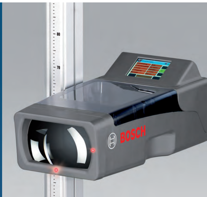
Лазерное перекрестие встроено в корпус